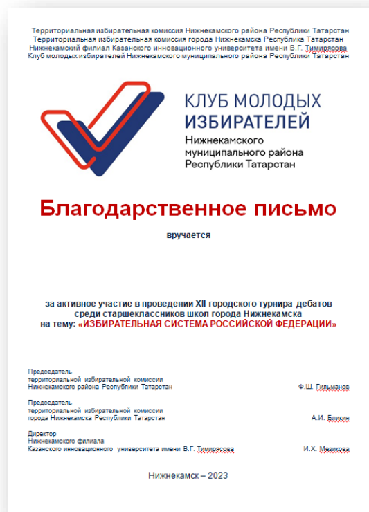
Рис. 9. Образец сертификата за участие в турнире учащихся старших классов школ города Нижнекамска по дебатам