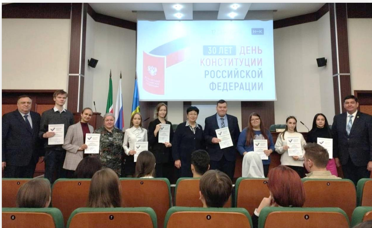
Фото 5. Торжественная церемония награждения организаторов Турнира дебатов