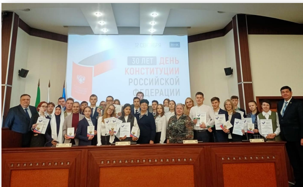
Фото 6. Торжественная церемония награждения победителей и участников Турнира дебатов