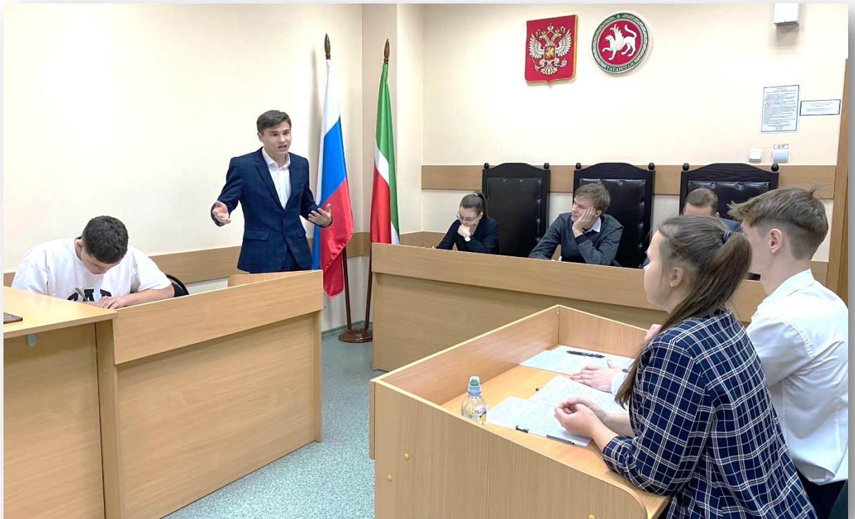
Фото 3. Турнир дебатов